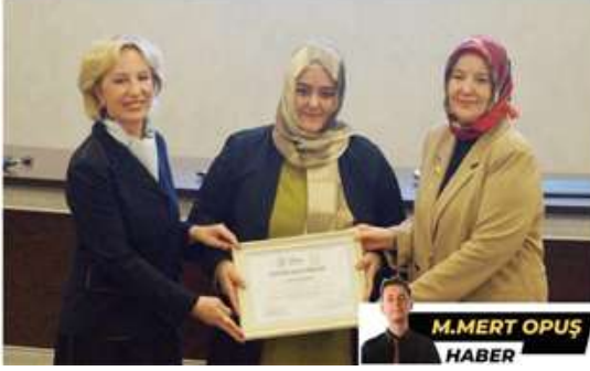
M.MERT OPUŞ HABER

ması gerektiğini belirten Argat, özellikle inşaat sektöründe kadınların çalışma oranlarının oldukça düşük olduğuna dikkat çekti. Türkiye'de kadınların inşaat sektöründe çalışma oranının AB ülkelerine kıyasla çok daha düşük olduğunu belirten Argat, "Kadınların sanayi ve teknik alanlarda daha fazla yer alması, sadece ekonomik refahın artmasına değil, aynı zamanda toplumdaki cinsiyet eşitsizliğinin ortadan kaldırılmasına da katkı sağlar" dedi.